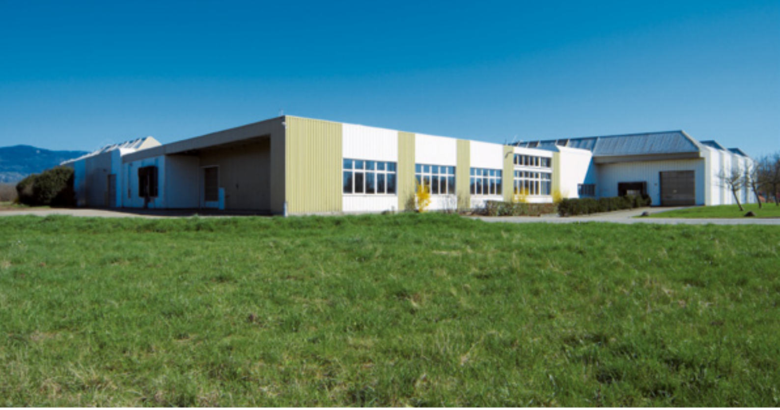
Depo girişlerinde büyük tırlar için rampa ve geçiş yerleri