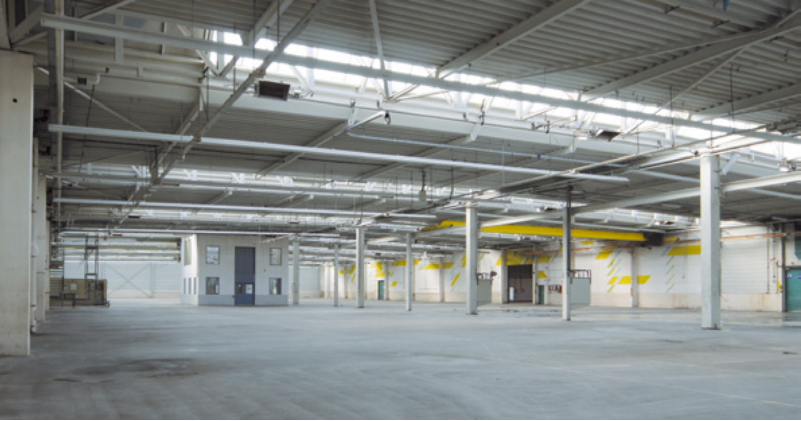
Yüksek ve gündüz ışığından aydın fabrikasyon bölümü. Depo tabanı ağır yükler için kullanışlı.

Direksiz ve yüklü malzemeler için kullanışlı depolar: tüm üretimler ve lojistik için uygun