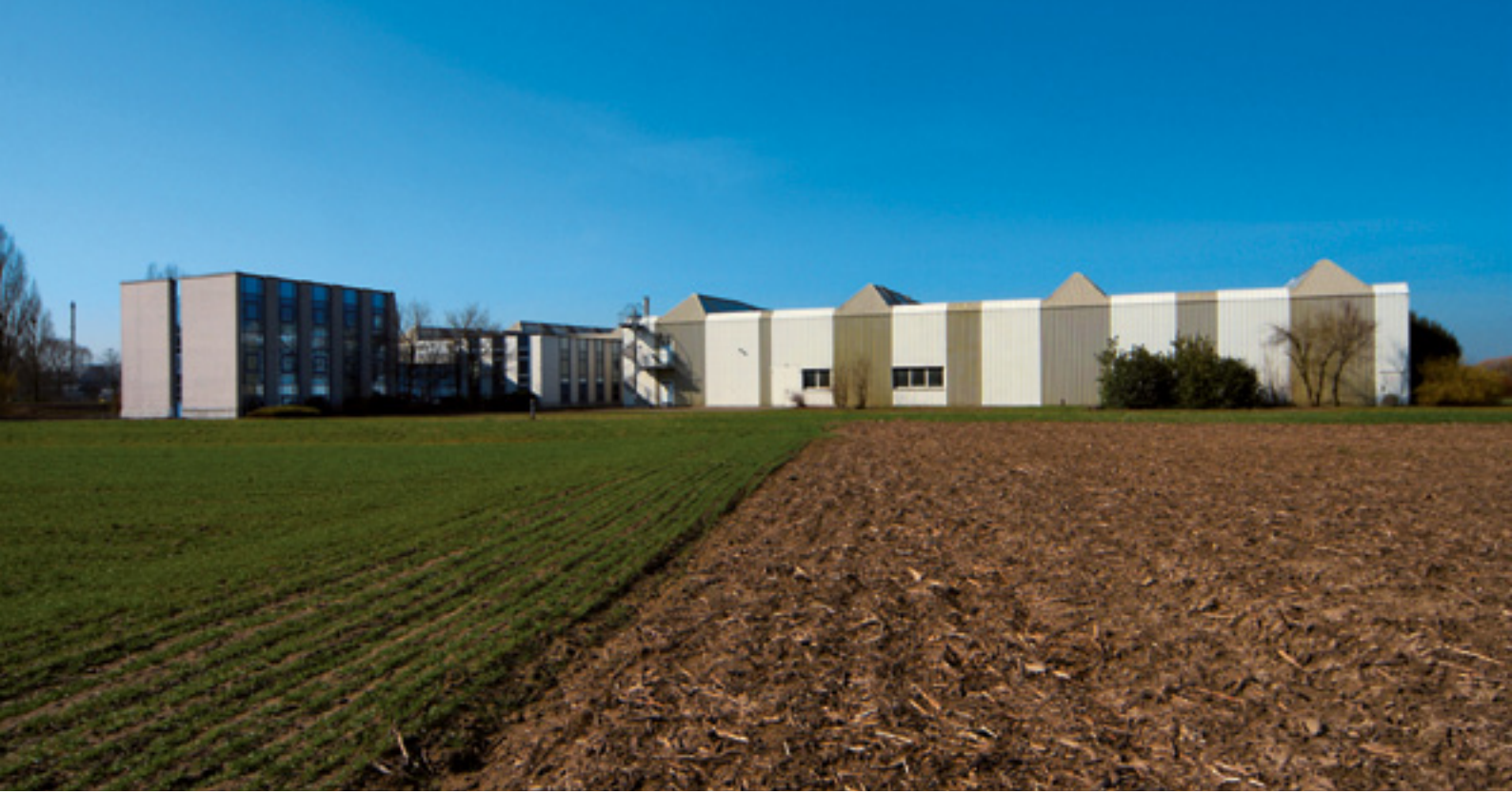
Üretim bölümüne bağlantılı 2 ofis binası