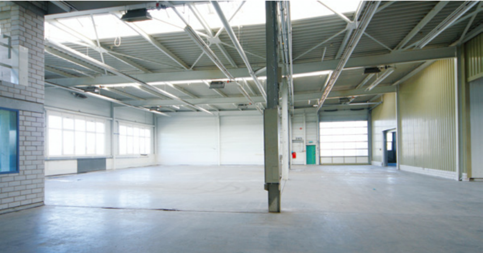
Çeşitli kullanımlar için bağlantılı 4 depo