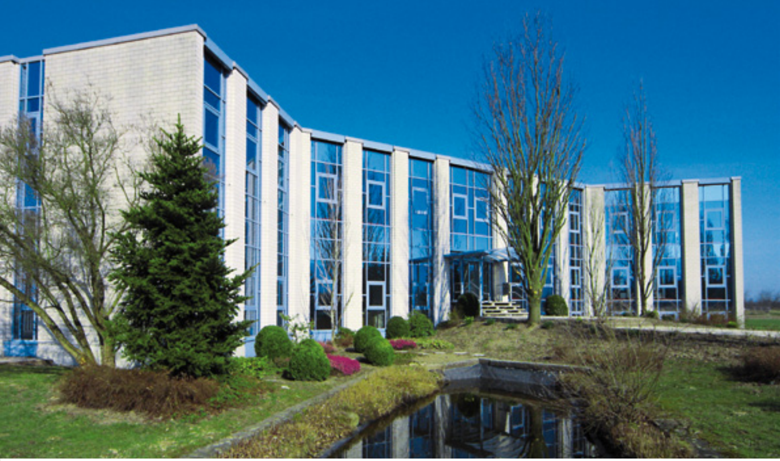
Bina girişinde elemanlar, müşteriler ve misafirler için oto park